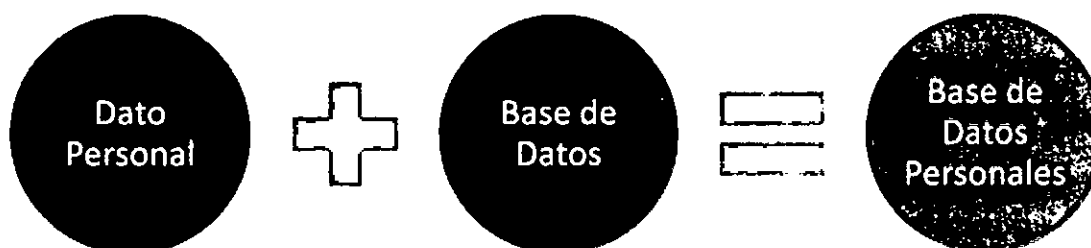
Figura 1. Conceptos Básicos. Dato Personal

No obstante, con la finalidad de facilitar el entendimiento de estos lineamientos, se detallan los siguientes conceptos: